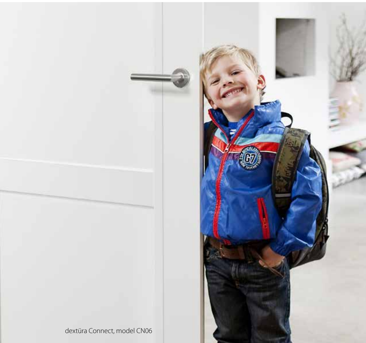
dextūra Connect, model CN06