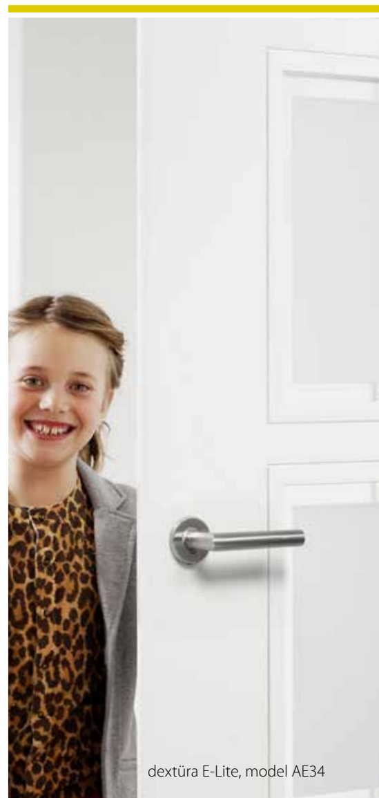
dextúra E-Lite, model AE34

Malo ljudi je seznanjenih s tem: Spodnji rob dextúra vrat je zapečaten s posebnim lepilom iz voska. Tako so vrata še dodatno zaščitena pred vlago.