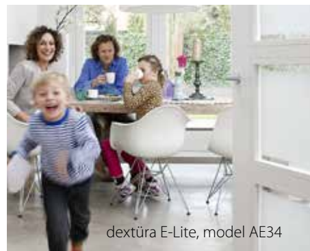
dextūra E-Lite, model AE34