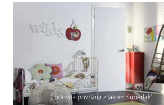
Čudovita površina z lakom Superlak®