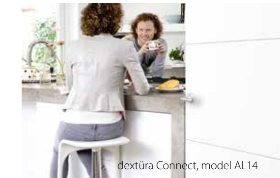
dextūra Connect, model AL14